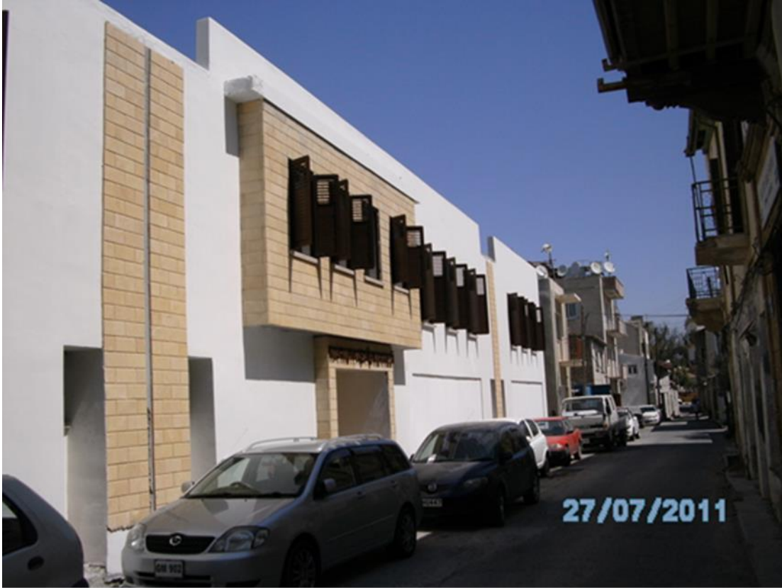
Lefkoşa Park Evleri Sitesi Değirmenlik