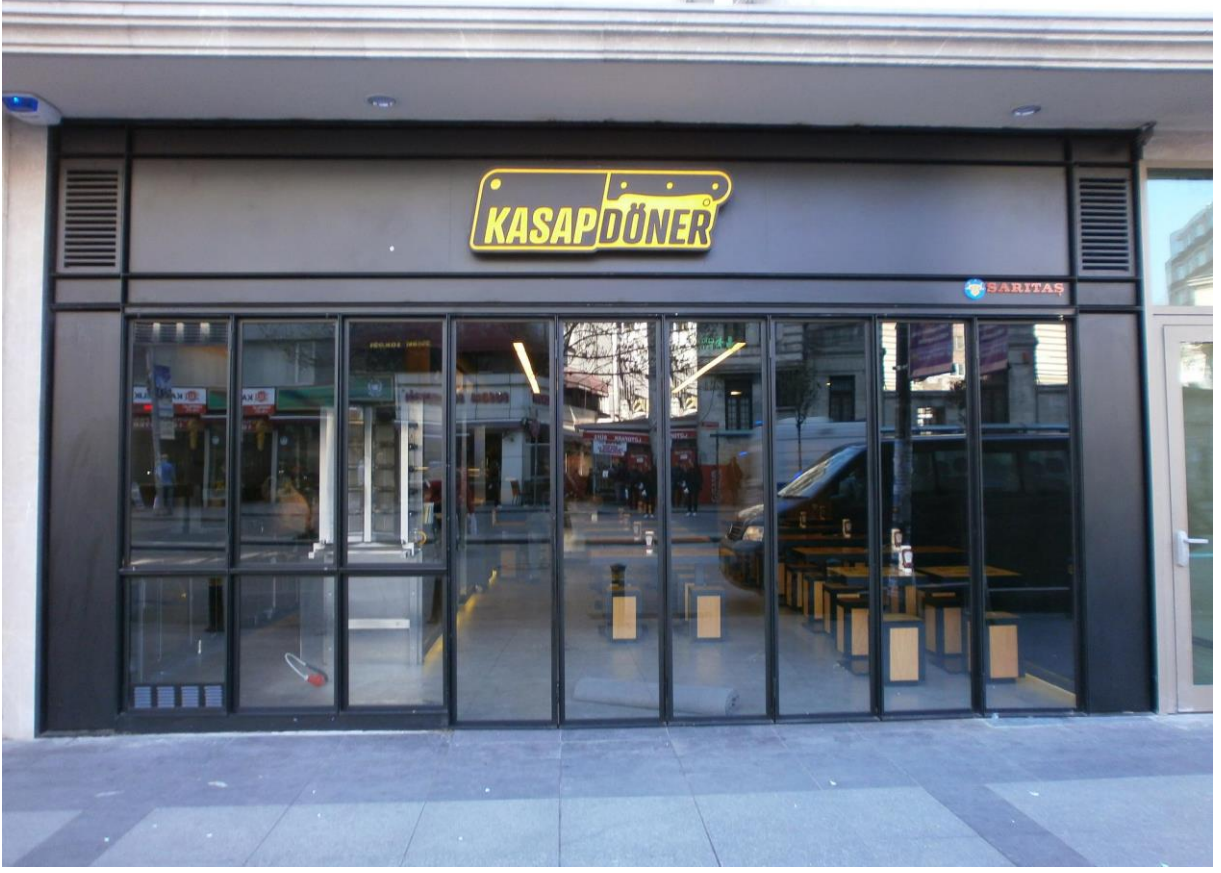
KASAP DÖNER LEFKOŞA