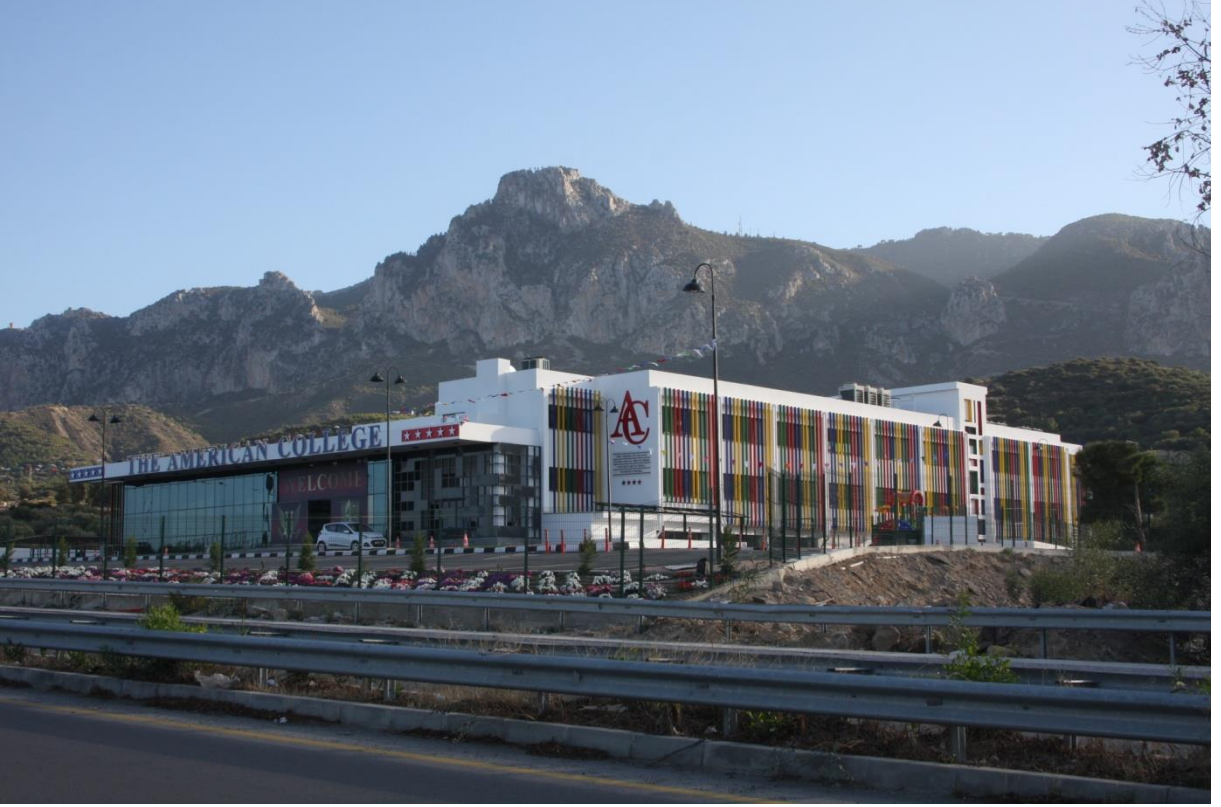
GAÜ KOLEJ BİNASI