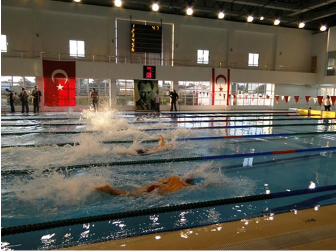
Mahmut Kapalı Otopark Projesi Lefkoşa Paşa