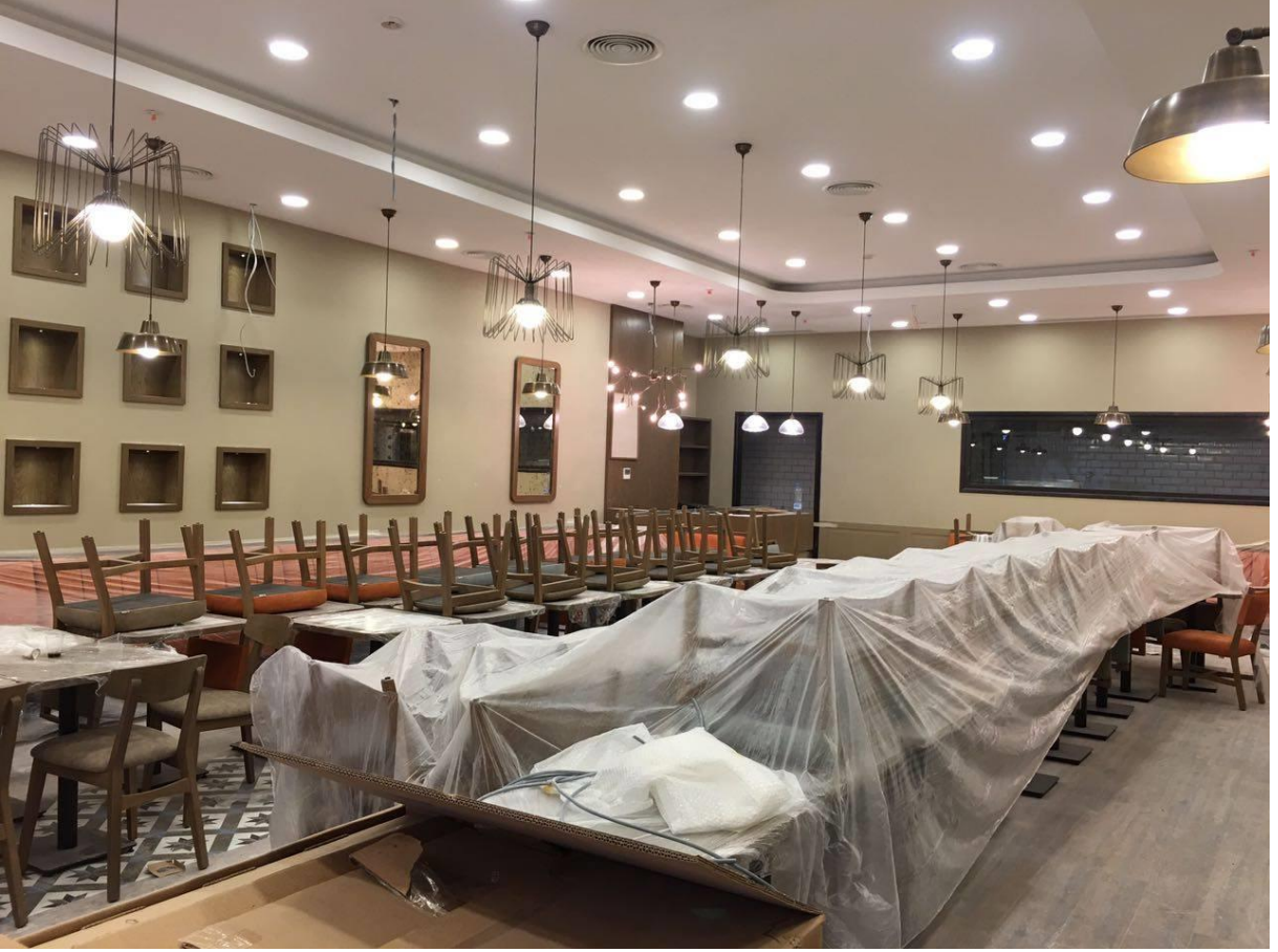
BAY DÖNER RESTORAN CİTY MALL